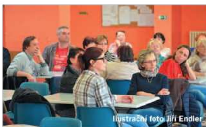
Ilustrační foto Jiří Endler

Letošní jaro by mělo přinést jakýsi restart této přímé komunikace magistrátu s občany v podobě, jaká je v Jablonci nad Nisou zažitá. Znamená to, že zástupci města zavítají k přímé debatě